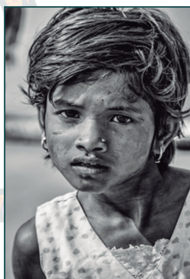
Niña en Vietnam, Carlos de Rivas

1ª SECCIÓN: 10 retratos de personas de diferentes culturas en sus lugares de origen fotografiadas por el autor Carlos de Rivas durante su trayectoria artística en su especialidad de fotografía antropológica. Carlos de Rivas hará una selección de 10 retratos para estas jornadas.