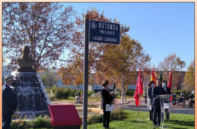
Rotonda del Presidente Lázaro Cárdenas: por fin tiene su señalización y su placa gracias a nuestras peticiones.