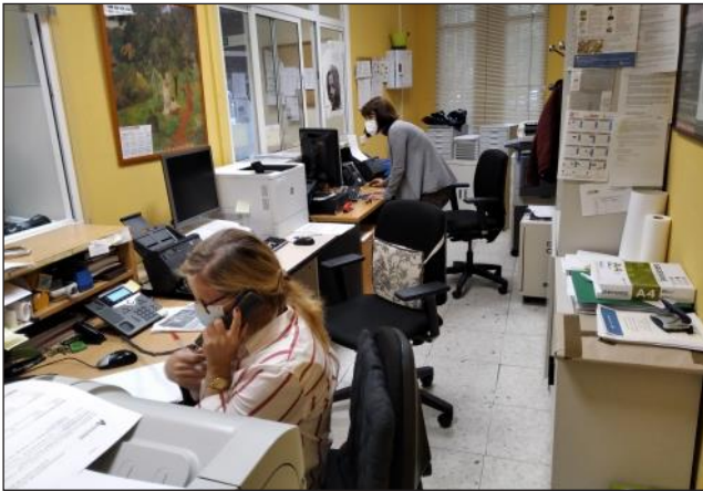
Funcionarias trabajando en un espacio reducido en la Junta de Distrito

cia Alcalá (pag.18) que la adaptación de este local está presupuestada en 100.000 euros y además tendrán que dotarlo de todos los medios y personal necesarios para atender las demandas de tantos vecinos respecto al IMV y otros servicios sociales, y estamos convencidos de que esto es necesario.