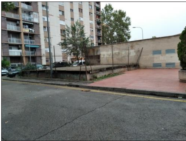
Aspecto de una zona de la calle Sigüenza

esta última calle desemboca en la Avda. Castilla (al menos en el callejero). Una plataforma sobreelevada de hormigón vallada malamente y que creemos no tiene uso hace quebrar el vial, los coches aparcan malamente y aceras y alcorques precisan una reposición. Pensamos que son una serie de quiebros incomprensibles. Esta calle necesita un buen estudio por Urbanismo y proceder en su caso a hacer una remodelación integral incluso con la destrucción de las instalaciones obsoletas si las hubiere, pensando sobre todo en esa plataforma de hormigón.