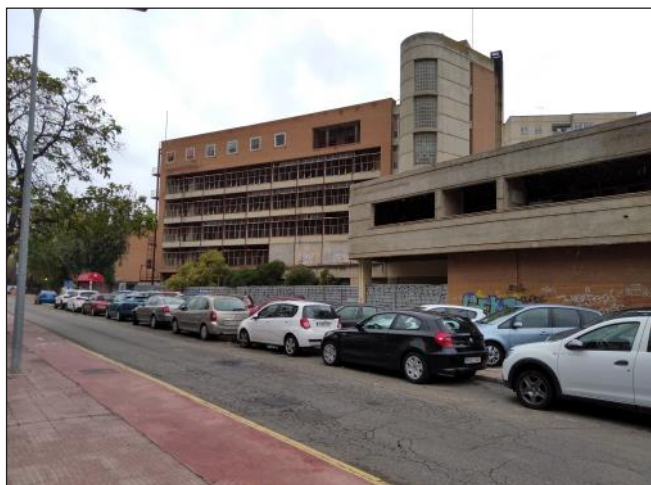
Estado actual del ambulatorio del Val

cómo va este asunto, pero ni por esas. ¿Hasta cuándo hemos de seguir esperando?