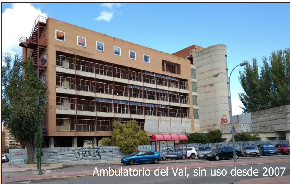
Ambulatorio del Val, sin uso desde 2007

Si hubiera estado abierto, habría ayudado a reducir los problemas de la pandemia