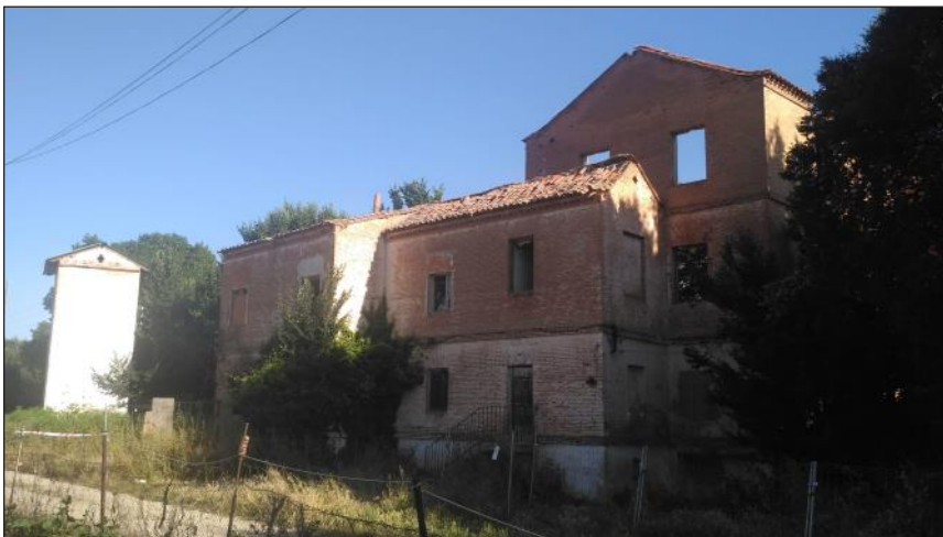
El molino de Cayo o lo que queda de él

Concluimos que conocer para conservar la naturaleza sigue siendo una asignatura pendiente para las administraciones públicas en general y el ayuntamiento de Alcalá de Henares en particular. □