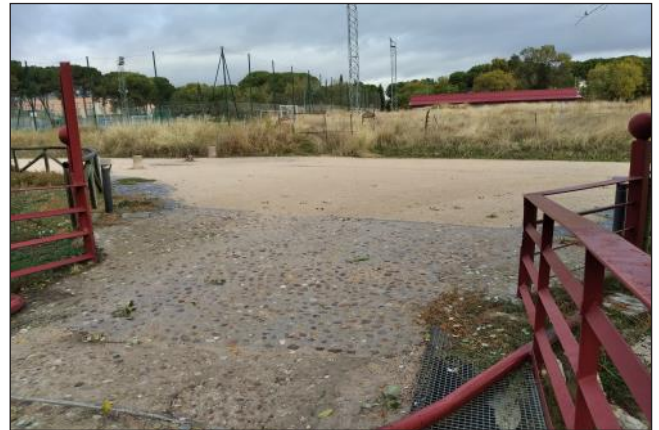
Vista desde el puente de la Oruga de la zona sin uso por donde proponemos el paso de vehículos

Propusimos en la JMDV de 20 mayo 2012 suprimir este acceso por la Vía Pecuaria (debería estar prohibido por ley) y habilitar un nuevo acceso desde la calle Cogolludo, que conduce perpendicularmente al mismo Puente, para lo que