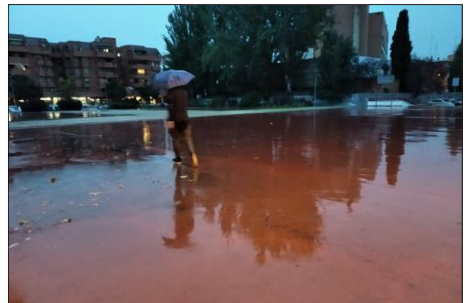
La plaza de Huesca un día de lluvia cualquiera

Este es el nombre de la explanada sin acondicionar existente entre el colegio Pablo Picasso y el viejo ambulatorio del Val sobre un aparcamiento subterráneo. Los vecinos lo utilizamos como paso peatonal desde la Av. Castilla a la calle Alicante o a la calle Salamanca. Cuando llueve, transitar por ella es peligroso, queda muy encharcada y resbaladiza en su zona de cemento, también muy deteriorado, y el resto es un barrizal. Además de eso, las quejas de los usuarios del garaje que hay en el subsuelo por las filtraciones y humedades que se producen son históricas.