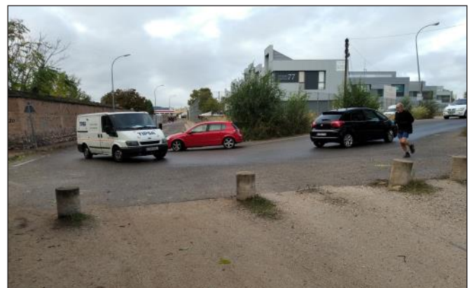
Estrechamiento peligroso en la acera y la calzada en el Camino de Afligidos

Este Camino es muy utilizado por peatones, ciclistas, vehículos, góndolas que transportan vehículos, camiones, hay varias discotecas... Es un vial muy peligroso para todos. Casi al final del vial asfaltado se estrechan las aceras y el vial, se pierde el carril bici y hay una curva muy peligrosa sin visibilidad. El estrechamiento se produce por una antigua valla que delimitaba una propiedad y que ha quedado obsoleta al construir dicha propiedad una nueva valla interior. Ahora ha quedado un espacio muerto entre las dos vallas y todos agradeceríamos que se pueda retirar la antigua cuanto antes por quien sea competente