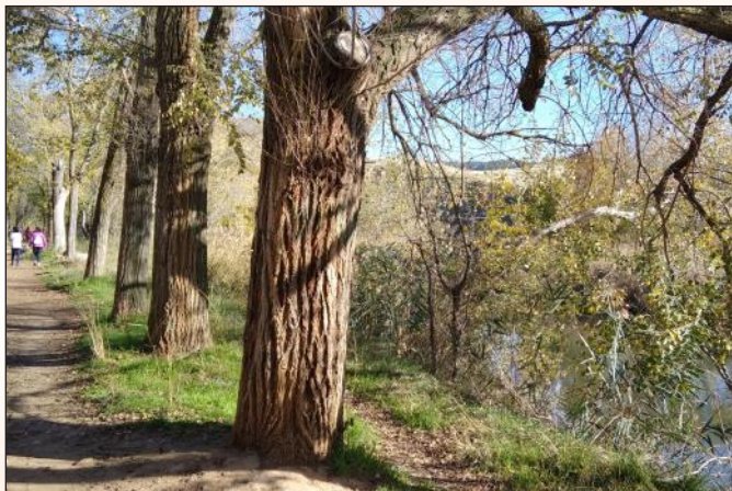
Acercar el río a la ciudad, no la ciudad al río. Que esté limpio y cuidado, pero no urbanizado, como pretende el absurdo proyecto municipal. Los caminos naturales son suficientes.