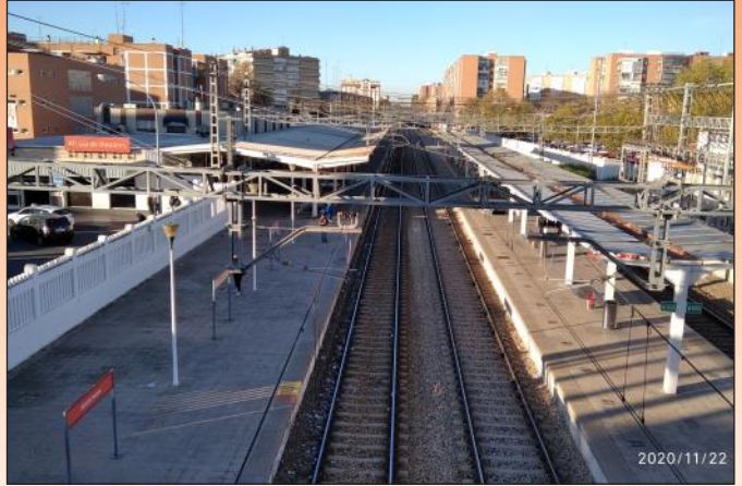
La estación de Renfe Alcalá sigue sin escaleras automáticas, rampas o ascensores para discapacitados, aunque se ha pedido un montón de veces.