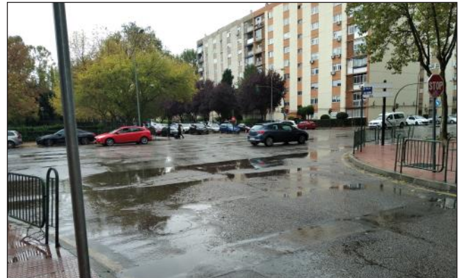
Lugar donde debería ir la rotonda de calle Santander con Lope de Figueroa

un retraso para los vecinos de 10 años. Por favor, no nos confundan, aclárense y resuélvanlo cuanto antes. Y una pregunta: si el PIR tarda tanto en decidirse ¿no se podía acelerar con cargo a otras partidas?