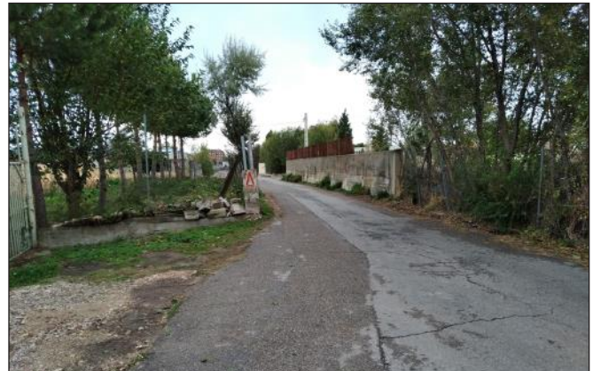
El Camino de Afligidos después de la calle Ávila: hace quince años que prometieron su arreglo.

No es la primera vez que se trata el lamentable estado en que se encuentra este Camino ya convertido en calle, antes denominado “Camino de los Santos” (hay una placa histórica que así lo señala). Hace quince años en un Pleno Municipal se debatió arreglarlo pero sin resultado. Es una calle con bastante tráfico. En ella confluyen la salida de autobuses interurbanos para Madrid, la sede de Protección Civil, las antiguas naves de Obras y Servicios, el Punto Limpio... por la “acera” izquierda. Por la derecha la entrada y