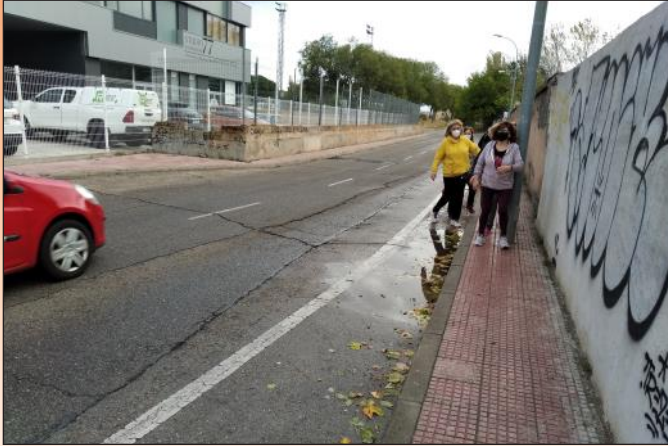
Final del Camino de Afligidos: es una vergüenza este estrechamiento que dura tantos años con el peligro de atropellos que está conllevando.