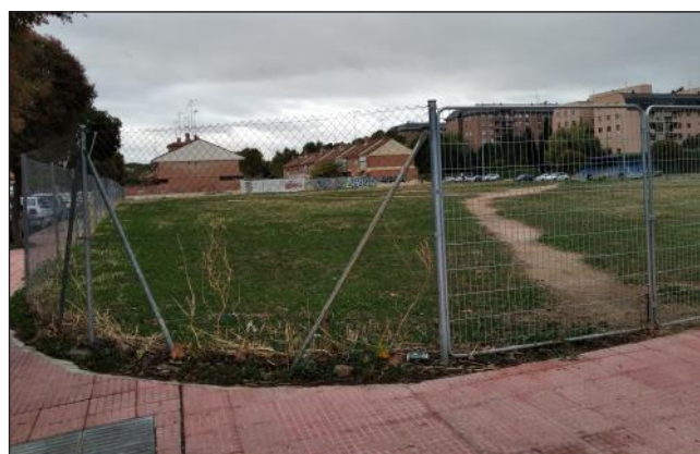
Solares en nuestro distrito propiedad del obispado

¿Y qué decir de la parcela de Finangás , suelo