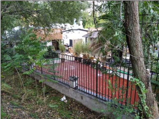
Una de las parcelas para uso deportivo ocupadas en la Av. del Val

tica concedida. Por nuestra parte, decir que ninguno de los establecimientos hosteleros aparecen en la base cartográfica del Catastro. ¿Por qué? Y otra cosa, si estos negocios son privados nuestra duda es si están pagando sus correspondientes impuestos y tasas. El Ayuntamiento debería aclararlo.