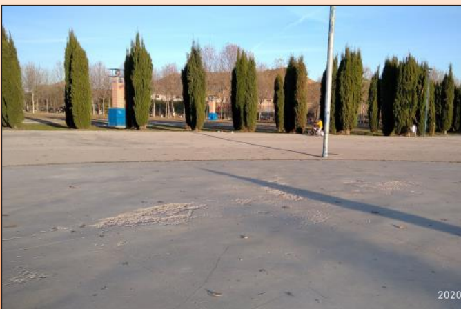
La pandemia nos ha traído algo positivo: este invierno no tendremos que aguantar la bochornosa "Ciudad de la Navidad". Que aprovechen para arreglar la pista tan deteriorada y ponerle unos bancos alrededor.