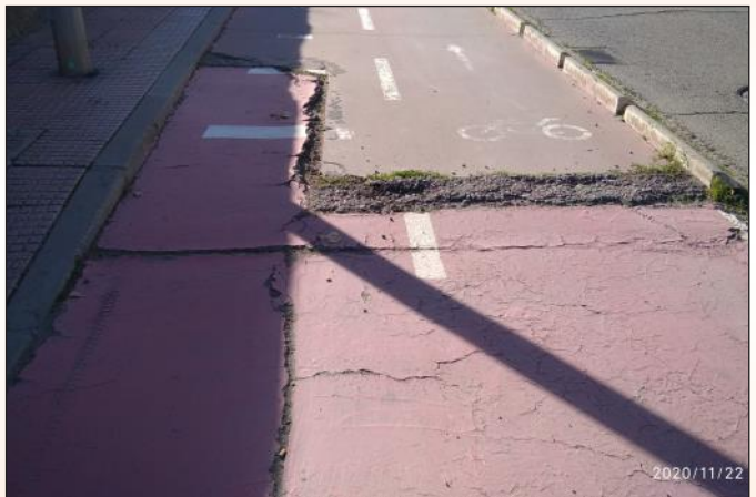
Aunque muchos carriles bici están infrutilizados (por su diseño inapropiado) al menos hay que mantener bien los que tenemos.