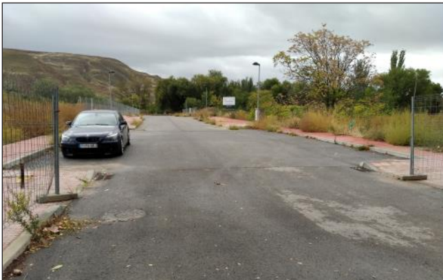
Calle construida ya en la parcela de Finangás para las viviendas allí proyectadas.

Situada en la parcela de la Villa Romana del Val, de donde fue segregada hace 14 años por el PP con la oposición de PSOE e IU, todavía colea la barbaridad de querer construir 286 viviendas. El concejal que lo defendió entonces fue claro: “Así se pondrá en valor ese yacimiento arqueológico”. Posteriormente, en 2016, el Ayuntamiento surgido en 2015 aprobó definitivamente el proyecto de urbanización. Desde entonces vemos cómo “gota a gota” se ha construido una calle central, explanaciones de terreno, nuevos viales, farolas, cajas de registro... También han realizado nuevas catas arqueológicas y delimitado con vallas los restos encontrados, pero ¿no sería posible parar esta tropelía contra nuestro Patrimo-